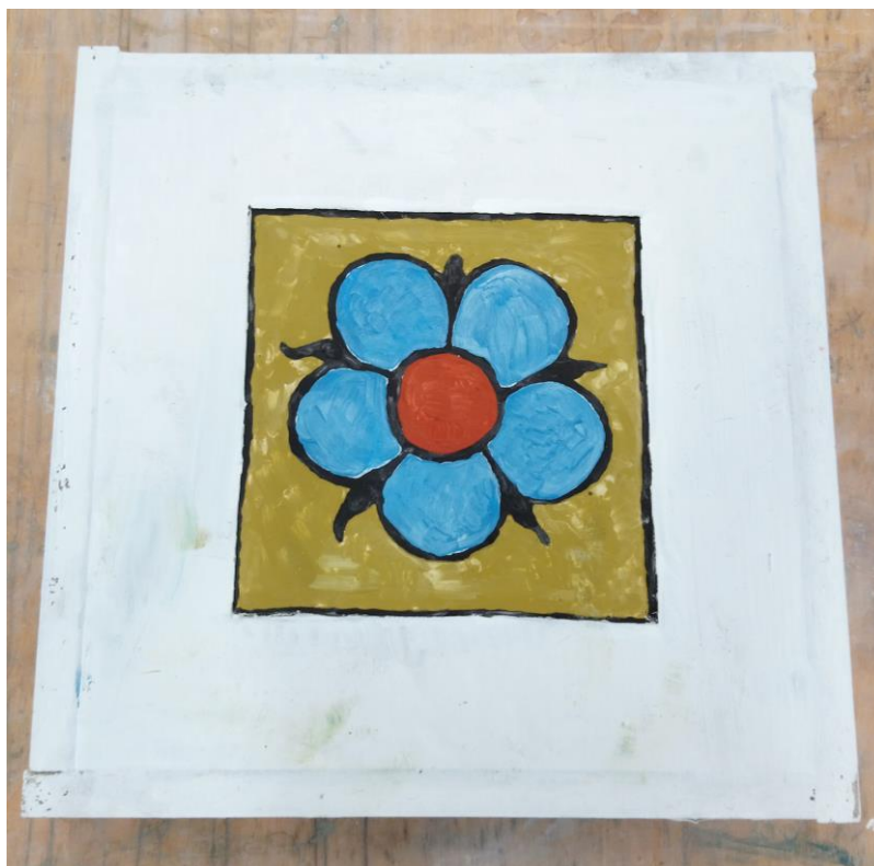
Rysunek 1. Widok gotowego fresku

Wykonany fresk pozostaw na stanowisku egzaminacyjnym.