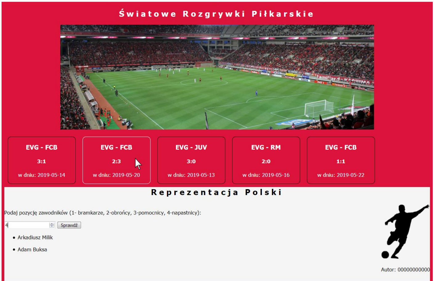
Obraz 2. Witryna internetowa, kursor na drugim bloku informacyjnym, zmienił się kolor obramowania