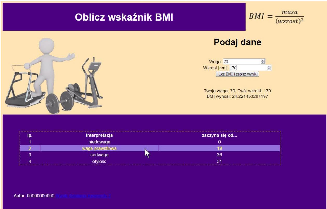
Obraz 2. Witryna internetowa, kursor na trzecim wierszu tabeli, zmienił się kolor tła i czcionki