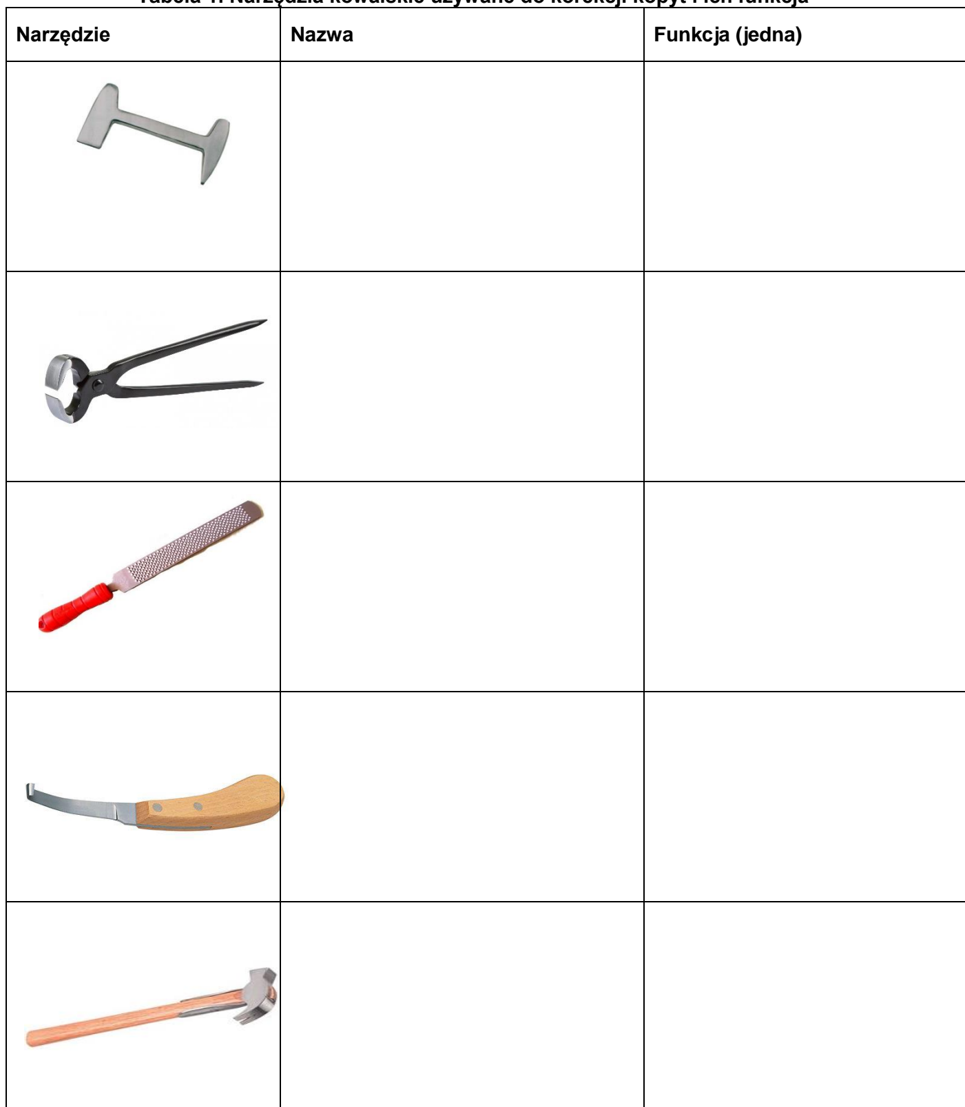
Tabela 1. Narzędzia kowalskie używane do korekcji kopyt i ich funkcja