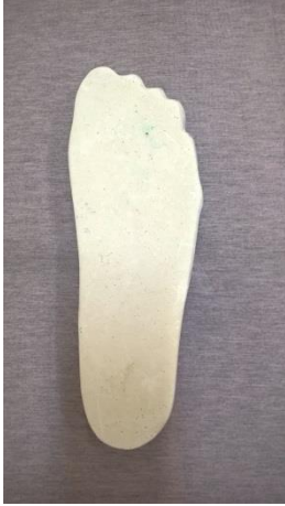
Zdjęcie 1. Widok pozytywu stopy z góry