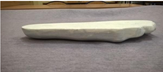
Zdjęcie 3. Widok pozytywu stopy od zewnętrznej strony