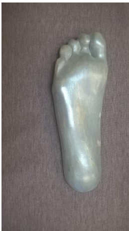
Zdjęcie 2. Widok pozytywu stopy od spodu