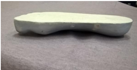
Zdjęcie 4. Widok pozytywu stopy od przyśrodkowej strony